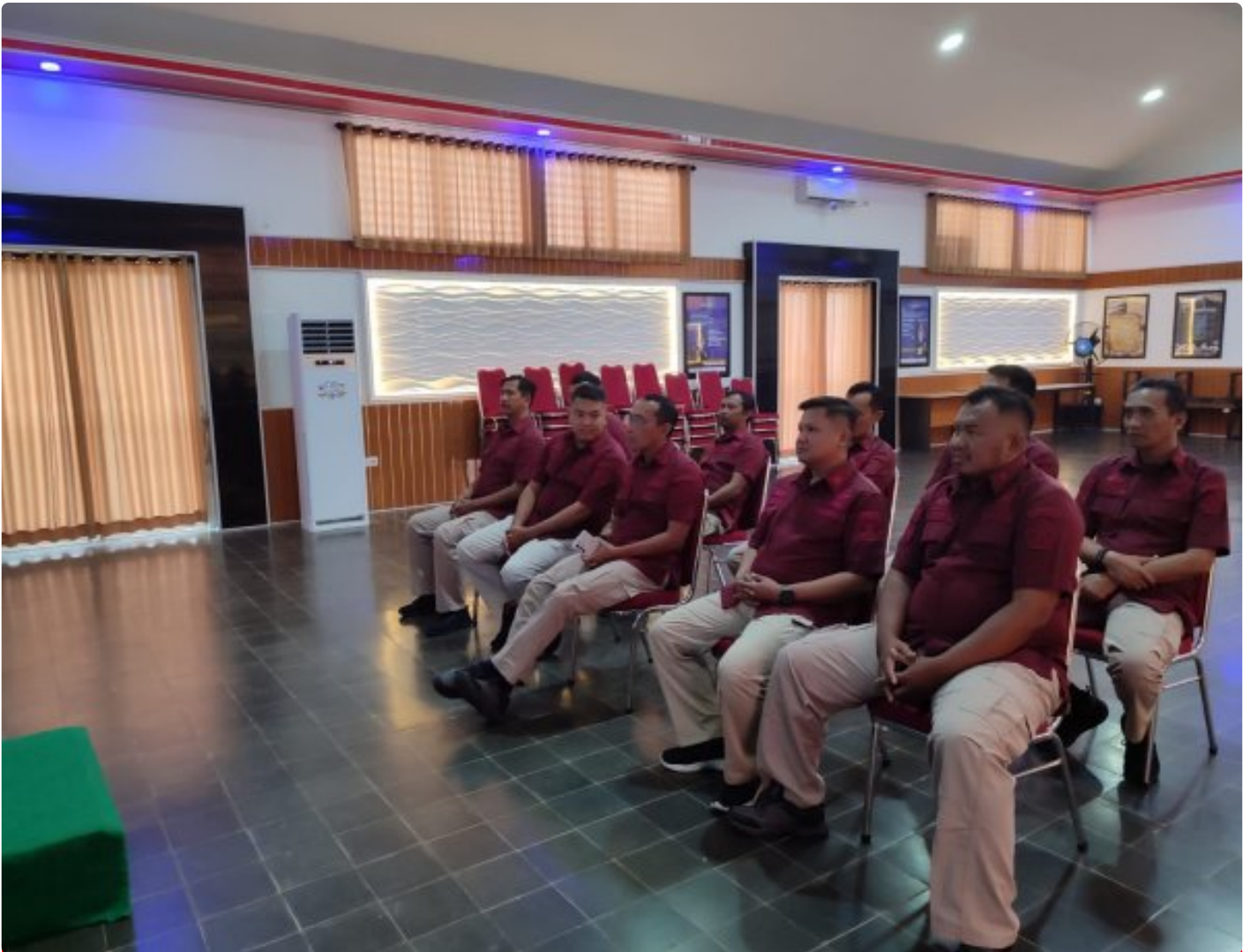
Bangun Personal Branding ASN, Lapas Besi Hadiri Webinar Series 6

CILACAP – Petugas Lapas Kelas IIA Besi Nusakambangan menghadiri kegiatan Webinar Series 6 yang diselenggarakan oleh Badan Pengembangan Sumber Daya Hukum (BPSDM) dan HAM bertempat di Aula Wijaya Kusuma, Kamis (24/10/2024).